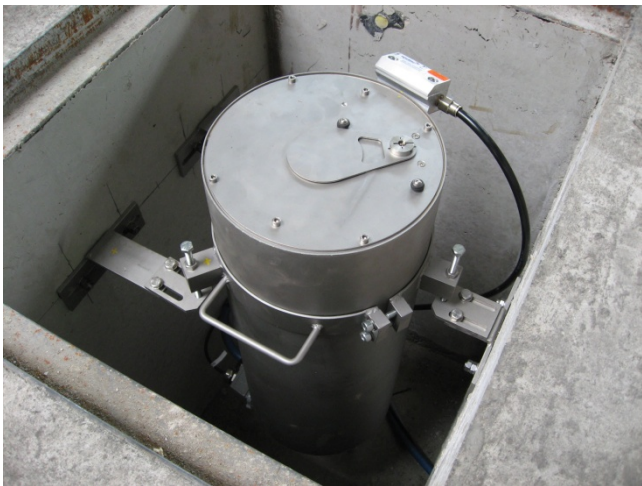
Abb. 3: Edelstahlgehäuse mit pneumatisch angetriebener Schutzklappe zum Schutz des Messgerätes, der Wandlerkomponenten und Sensoren im Messkopf

Dadurch können korrekte Einstellungen nicht unauthorisiert verändert werden. Um den bedienerlosen Betrieb des Thermografie-Messsystems zu gewährleisten, ist es möglich, die Software zur Analyse der Messergebnisse automatisch im Prüfmodus zu starten. Qualitätsrelevante Einstellungen wie das Einlernen und Ändern der Formteilverlagen können nur von berechtigten Personen durchgeführt werden. Passend zu jedem Formteil können diese Personen einen Parametersatz anlegen. Dieser wird von der Pressensteuerung zur jeweils aktuellen Produktionsaufgabe herangezogen. Der Parametersatz enthält eine Nummer, ein Referenzbild mit der Messzone und Bewertungskriterien. Dadurch ist gewährleistet, dass bei einer Produktionsumstellung kein manueller Eingriff erforderlich ist und die Messung zuverlässig vom ersten Prüfobjekt an startet. Für diese Parametrierung wird das Pressgut mit einer variablen Software-Schablone maskiert. Dazu wird ein passendes Pressteil thermografisch analysiert. Für eine korrekte Messung ist der Emissionsgrad der Produktoberfläche einstellbar, welcher im Vorfeld ermittelt werden kann.