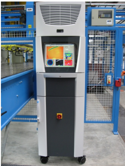
Abb. 1: Steuer- und Auswerteeinheit zur Bedienung der Kamera an der Presse und Übermittlung der Auswertung an die Pressensteuerung

flächenhaften Temperaturdifferenz-Verteilung gegeben. Die Einhaltung von prozessspezifischen Temperaturgrenzen wird über eine softwaretechnische Auswertung der erfassten Thermogramme sichergestellt. Wenn beispielsweise in einem zuvor definierten Bereich des Formteils eine höhere Temperatur gemessen wird, ist die erforderliche mechanische Festigkeit durch ausreichend ausgebildete Gefügestrukturen nicht gegeben und dieses Pressteil wird automatisch aussortiert. Der Ablauf der Messung wird durch einen Industrie-PC gesteuert, welcher an das übergeordnete Prozessleitsystem der Presse angekoppelt ist und von dort mit Informationen zum Prozessablauf versorgt wird. Die speziell an die Kundenanforderungen angepasste Thermografie-Software IRBIS® 3 organisiert den Messablauf und wertet digitale Bilddaten der Thermografie-Kamera aus. Die Ergebnisse werden dem Leitsystem des Produktionsprozesses im Taktzyklus der Presse übergeben. Es können verschiedene Pressformen verwaltet und deren zugehörige Messungen ausgewertet und protokolliert werden. Dies gewährleistet einen universellen Einsatz des Messsystems für die verschiedenen auf dieser Anlage laufenden Aufträge.