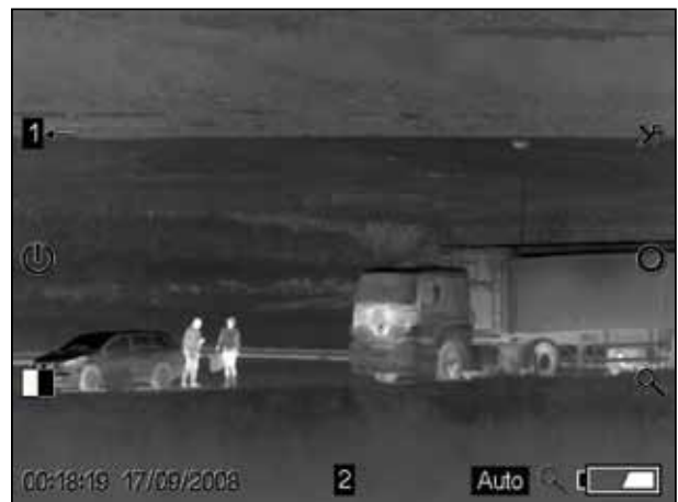
Überwachung und Aufklärung