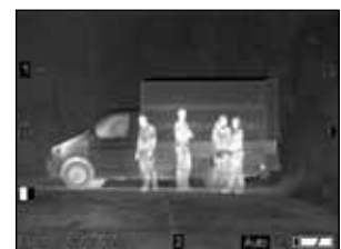
Identifikation von Personen