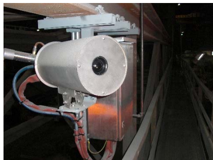
Wärmebildkamera im Schutzgehäuse