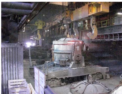
Gießpfanne im Prozessumlauf

Nun überwachen fünf präzise und industrietaugliche Wärmebildkameras alle Gießpfannen auf ihrem Transportweg vom Stahlwerk in die Stranggießanlage. Die Kameras der VarioCAM® high resolution-Serie können mit ihrer hohen geometrischen Auflösung schon kleine Defekte auflösen und ihre ausgezeichnete Temperaturlösung bietet die Chance, thermische Auffälligkeiten schon in ihren Anfangsstadien zu detektieren. Über das Software-Interface kann darüber hinaus die Temperaturentwicklung einzelner Pfannen über einen längeren Zeitraum verfolgt werden. Den besonderen Bedingungen, denen das System ausgesetzt ist, wird darüber hinaus z. B. durch robuste Schutzgehäuse Rechnung getragen, die mittels integrierter Luftspülung für durchweg korrekte Messungen sorgen. Temperaturmesswerte und etwaige Alarmierungen werden voll automatisch den jeweiligen Pfannen zugeordnet. Pfannendurchbrüche können somit frühzeitig verhindert werden. ArcelorMittal Bremen minimiert damit wirtschaftliche Risiken ebenso wie etwaige Folgen für die Gesundheit seiner Mitarbeiter.