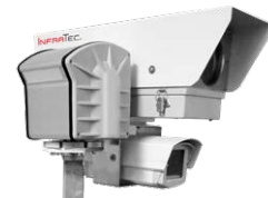
Schutzgehäuse für Thermografie- und visuelle Kamera auf einem Schwenk-Neige-Kopf