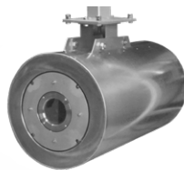
Spezialschutzgehäuse für Anwendungen in rauer Industrieumgebung, wie z. B. bei der Überwachung von Gießpfannen oder Schlacke-Detektion