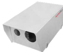
Schutzgehäuse für je eine Thermografie- und visuelle Kamera, Einsatz z. B. in Müllbunkern