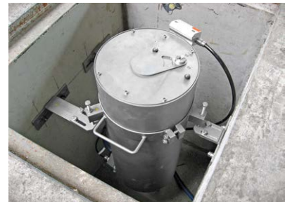
Schutzgehäuse mit Freiblasvorsatz, Kühlung und pneumatisch angetriebener Schutzklappe