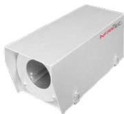
Schutzgehäuse für eine Thermografiekamera, Einsatz z. B. im Außenbereich