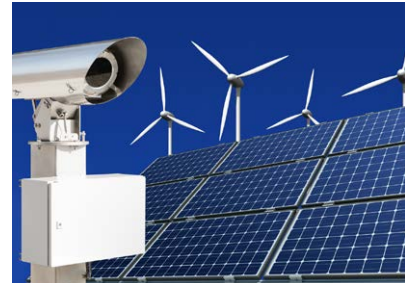
Edelstahl-Schutzgehäuse mit Schaltschrank für den Außeneinsatz