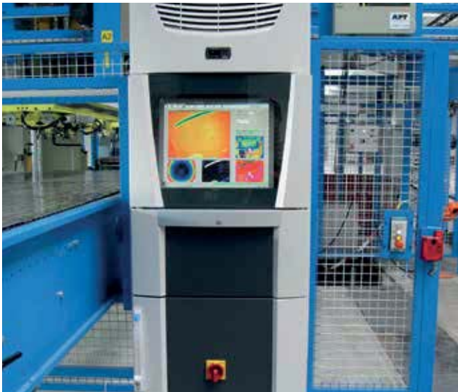
An der Steuereinheit läuft alles zusammen: Hier werden die Kameras bedient und die ausgewerteten Daten an die Pressensteuerung übermittelt.

system der Presse verbunden ist und von ihr Informationen zum Prozess sowie die Nummern der Bauteile bezieht. Im Taktzyklus der Presse übergibt die Software die Messergebnisse an das Leitsystem. Unterschiedliche Pressformen mit ihren zugehörigen Messungen lassen sich so verwalten. Der modulare Aufbau von Press-Check aus robusten, kompakten Teilen erlaubt es, das System auf die Anforderungen der jeweiligen Applikation zuzuschneiden.